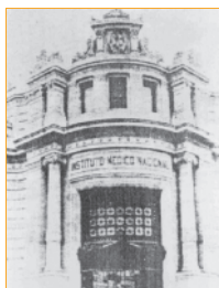
Contraportada: Fachada del Instituto Médico Nacional.