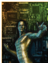
Separador: Jupiter Images.