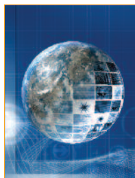
Separador: Jupiter Images.