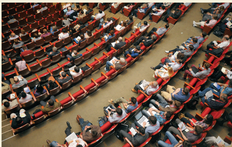
La transición de una conferencia presencial a una virtual puede reducir sustancialmente la huella de carbono en un 94%.

Tao, Y. et al. (2021), "Trend towards virtual and hybrid conferences may be an effective climate change mitigation strategy", Nature Communications , 12:7324. Disponible en: < doi.org/10.1038/s41467-021-27251-2 >, consultado el 17 de diciembre de 2021.