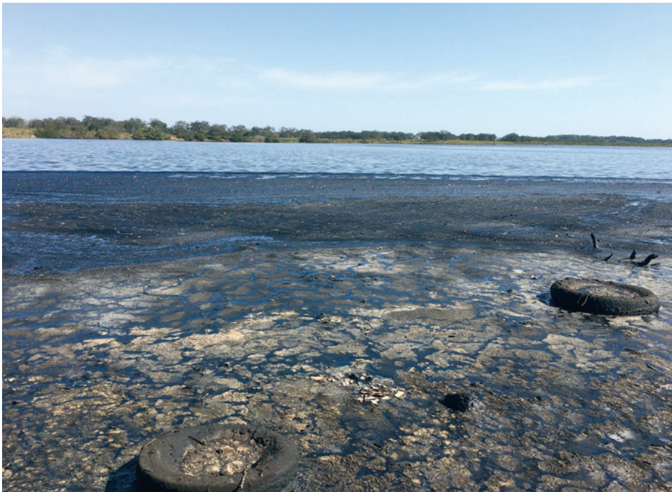
Figura 1. Derrame de petróleo del cráter del pozo petrolero de San Diego de la Mar, núm. 3, mejor conocido como Dos Bocas en Tamalín, Veracruz.

Por ello, la biorremediación surge como una alternativa para la degradación de compuestos orgánicos e inorgánicos. Este término surge a principios de la década de 1980 y se refiere al método que hace