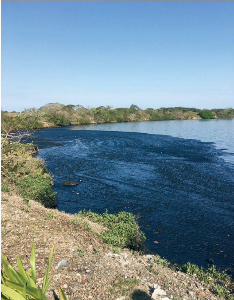
Figura 2. El sitio del desastre petrolero ocurrido en Dos Bocas en julio de 1908 no ha sido hasta la fecha restaurado.

uso de la capacidad de organismos vivos como los microorganismos para la degradación y eliminación de contaminantes presentes en el suelo, agua e incluso en el aire.