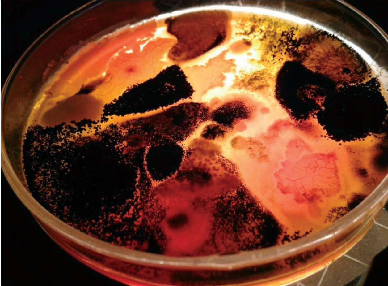
Figura 3. Una muestra del derrame en el ecosistema de Dos Bocas, Veracruz.

hidrocarburos alifáticos de cadena corta (como el butano o el metano)– se volatilizan dentro de las primeras horas después de ocurrido el derrame y suelen ser tóxicos para las bacterias, quedando los hidrocarburos poliaromáticos (como el naftaleno utilizado en la producción de insecticidas) y los heterocíclicos (por ejemplo, tiofeno, usado como aditivo en la industria de lubricantes y en agroquímicos), por lo que las bacterias que se encuentran en el sitio después de un derrame de petróleo son tolerantes y capaces de degradar estos compuestos. Sin embargo, cabe mencionar que el petróleo de fracción pesada e hidrocarburos de cadena larga (los cuales tienen mayor tendencia a permanecer en el medio ambiente después de un derrame) suelen ser más difíciles de degradar para las bacterias.